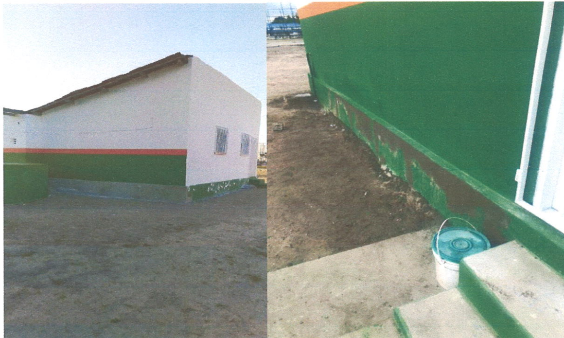
Execução de pintura.