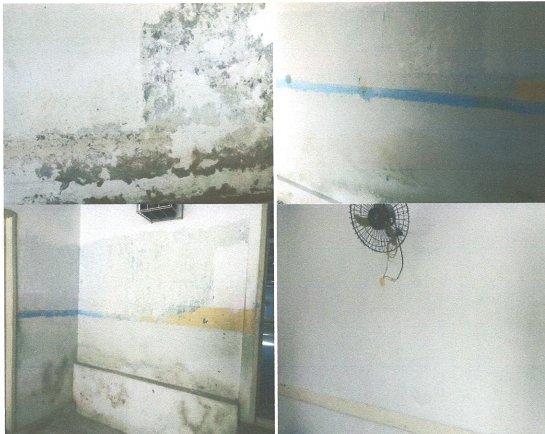
Preparação da superfície para receber pintura.