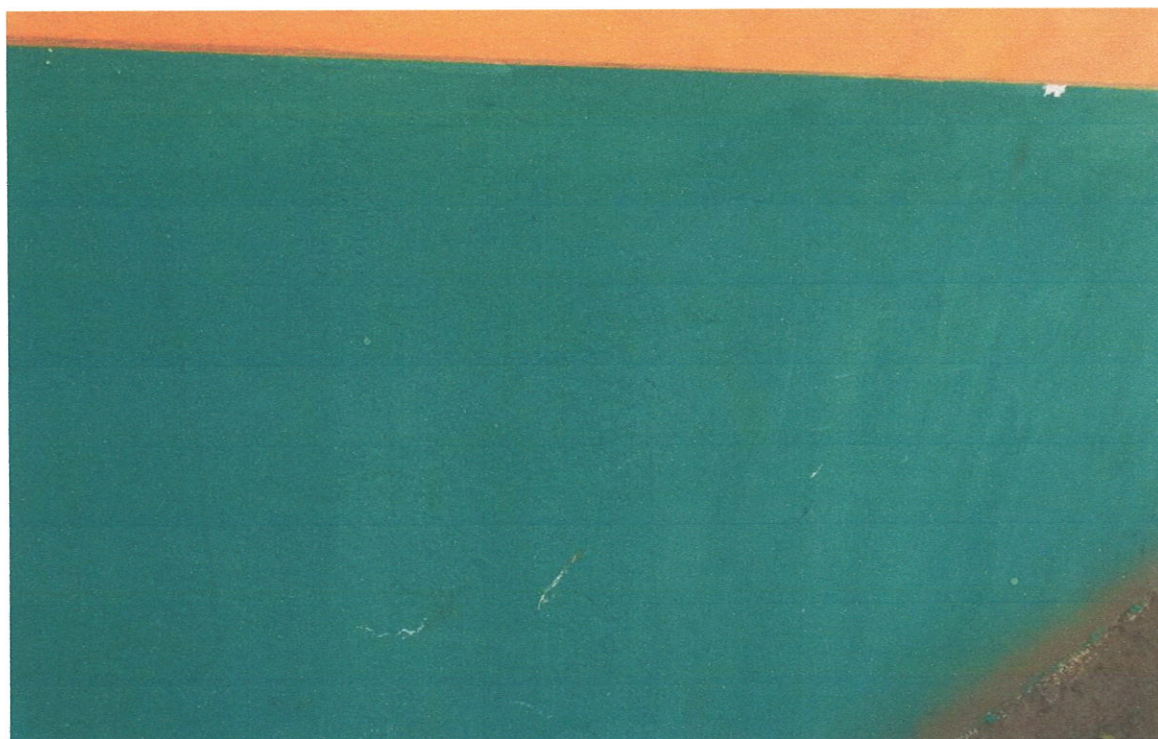
Execução de pintura.