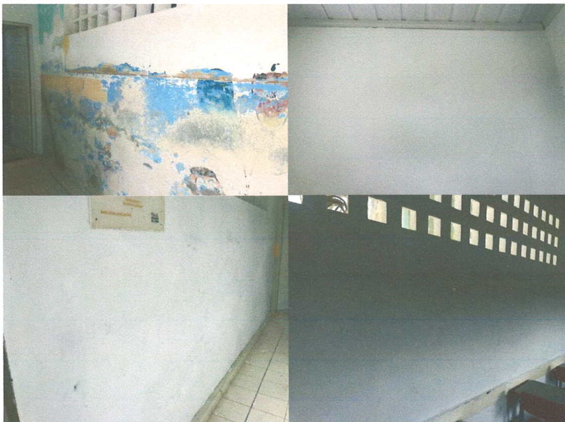
Preparação da superfície para receber pintura.