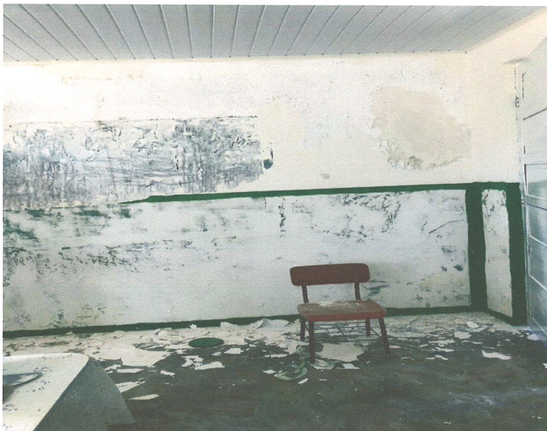
Preparação da superfície para receber pintura.